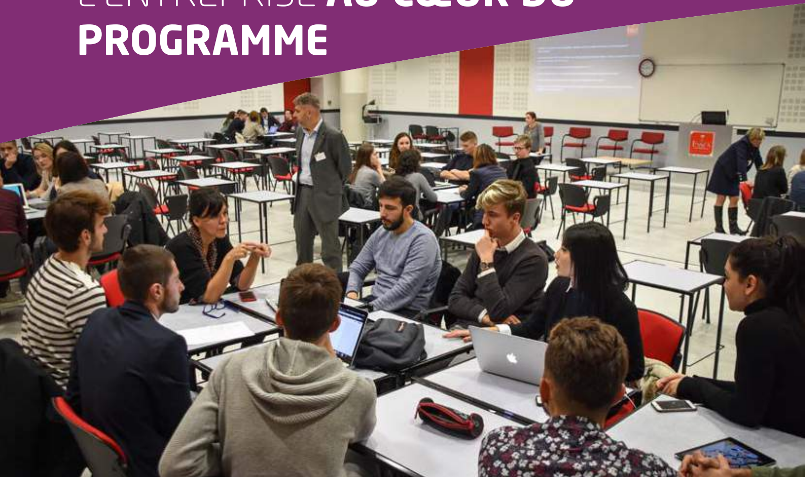
Atelier avec des représentants du Groupe Pasquier.

Les liens avec le monde de l'entreprise sont omniprésents dès le début du cursus et tout au long des 3 années d'études. Au-delà des cours animés par des professionnels, les étudiants assistent à des conférences-métiers, travaillent sur de nombreuses études de cas concrètes et participent à un Business Game.